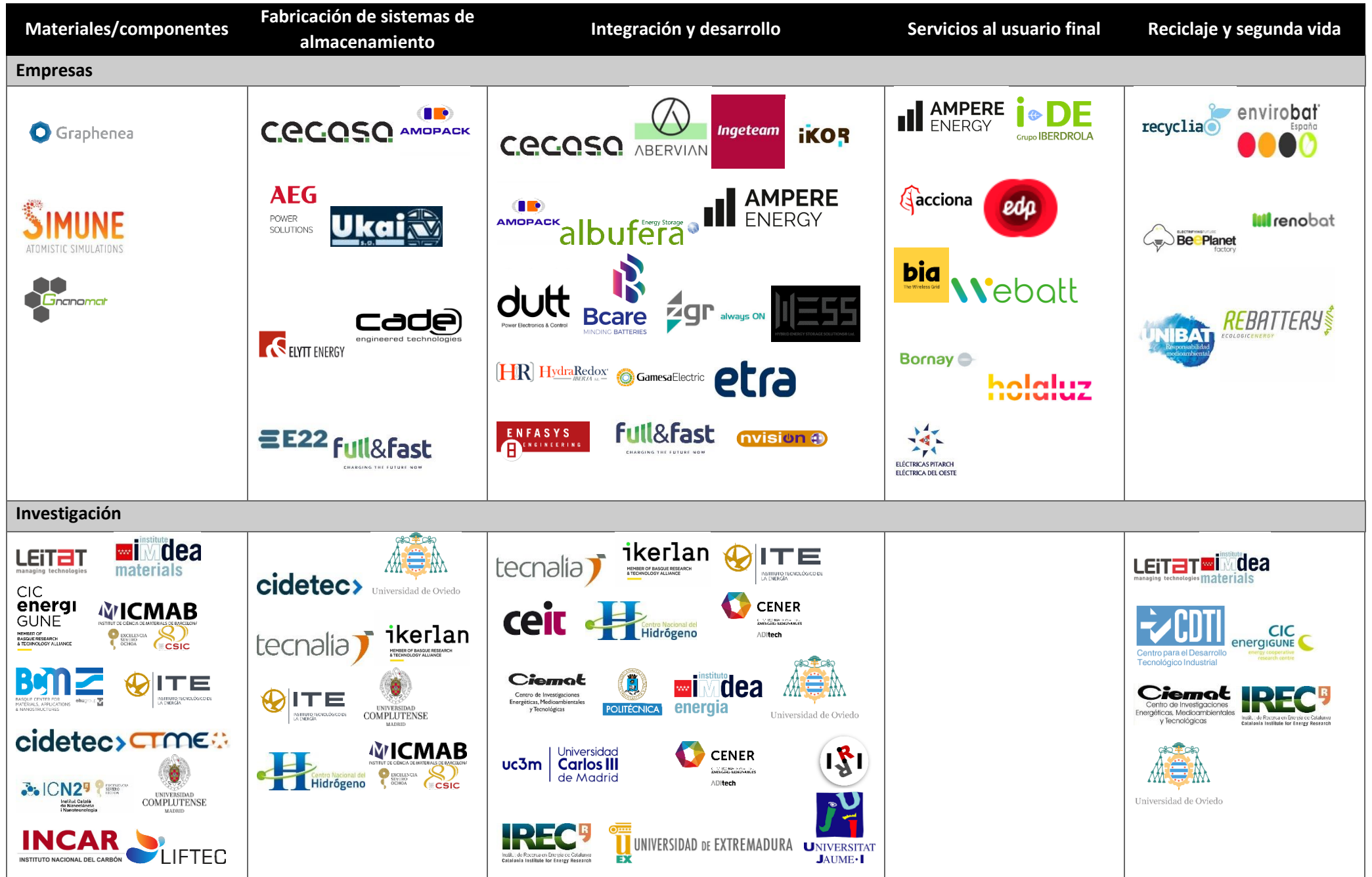
Tabla 1. Cadena de valor con empresas españolas del sector del almacenamiento.